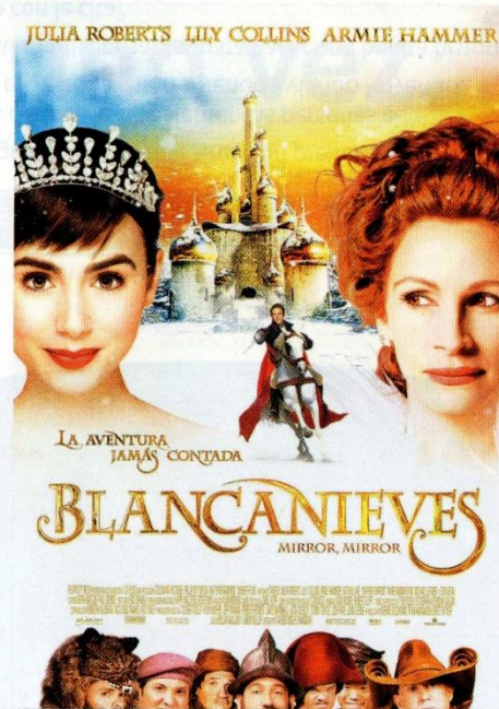
Tarsem Singh (India, 1961), Blancanieves , 2012.